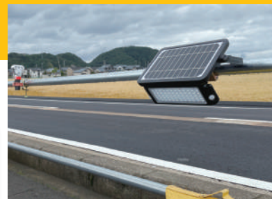
取り付け高さ/1m~5m推奨